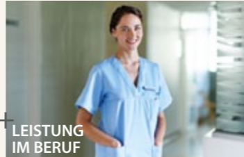
LEISTUNG IM BERUF