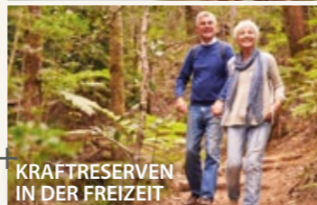
KRAFTRESERVEN IN DER FREIZEIT

Der patentierte Energie-Chip ist direkt am Nieren-Meridian eingearbeitet und stärkt somit Ihre körpereigene Energie.