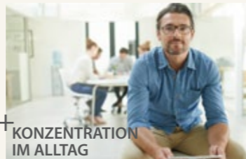
KONZENTRATION IM ALLTAG