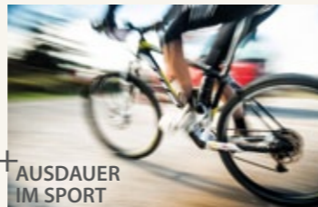
AUSDAUER IM SPORT

Detaillierte Informationen finden Sie im Internet unter www.geonado.de/forschungsberichte